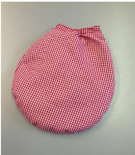
Sac à graines d'avoine d'un coussin chauffant. (marque Sterntaler)